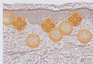
на глубокие слои